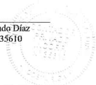
Sofía Obando Díaz CPI. N° 35610